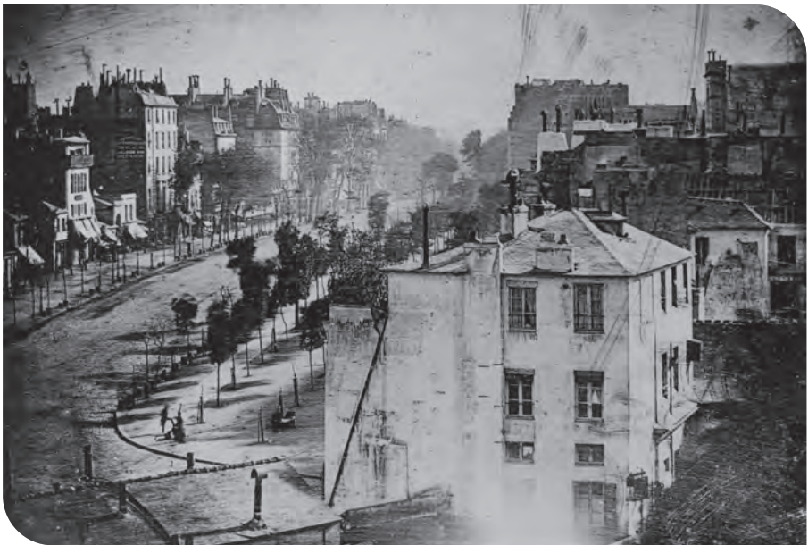
Louis Daguerre: Boulevard du Temple , 1839

Muybridge wird zudem der denkwürdige Satz zugeschrieben: »In nicht allzu ferner Zukunft wird man [...] eine ganze Oper, mit allen Gesten, Gesichtsausdrücken und Gesängen der Schauspieler sowie der Begleitmusik aufnehmen und mit Hilfe eines Geräts reproduzieren.« (Der Regisseur Max Ophüls schuf 60 Jahre später mit Die verkaufte Braut von Bedřich Smetana den ersten Opernfilm der Geschichte.) Man experimentierte, forschte, normierte und industrialisierte die neue Technik. Erstmals in der Menschheitsgeschichte drängten sich die Gräueltaten entfernter Katastrophen in die träge Gegenwart; die Fototechnik bot dem europäischen Publikum zum Morgenkaffee die Toten und Verstümmelten der Schlachtfelder des Amerikanischen Bürgerkrieges (1861–1865) in den Zeitungen dar. Um 1888 patentierte George Eastman (1854–1932) die erste Kodak-Kamera mit Zelluloid-Film, und zur Jahrhundertwende reiste der russische Fotograf Sergej Michailowitsch Prokudin-Gorski (1863–1944) durchs Zarenreich und dokumentierte das Land und seine Bewohner – mittels Farb fotografie. Eines der ersten Fotoateliers in Paris betrieb der Bohémien und Autodidakt Gaspard-Félix Tournachon (1820–1910), genannt Nadar. Mit seinen sensiblen Porträts der künstlerischen und politischen Prominenz der Zeit wurde er selbst berühmt und zum »Künstlerfotografen«. Ihm verdankt die Nachwelt beeindruckende Bilder, die den Betrachter