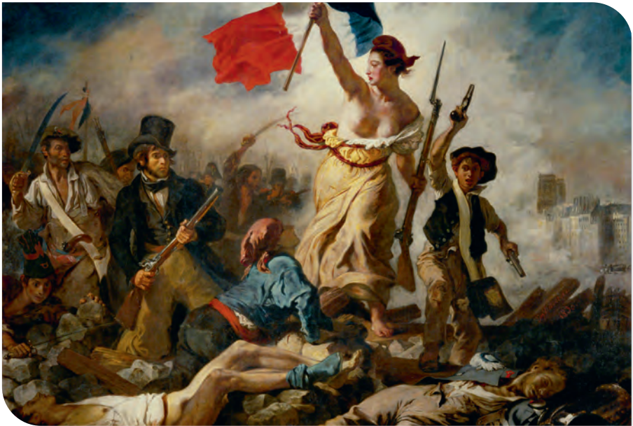
Eugène Delacroix: La Liberté guidant le peuple , 1830

Dabei hatte alles so vielversprechend begonnen. Im Jahre 1830 war die Julimonarchie des »Bürgerkönigs« Louis-Philippe I. ebenfalls mit einer Revolution eingeleitet worden. Der Leser mag sich einer Ikone jener Julirevolution entsinnen, eines Gemäldes von Eugène Delacroix (1798–1863). Es zeigt die Allegorie der Freiheit als barbusige Trägerin der damals verbotenen Trikolore beim Sturm auf die Barrikade. Ihr folgt, keineswegs kraftstrotzend begeistert, sondern vielmehr zögernd und skeptisch das Volk. Die Freiheit führt das Volk – das Bild war nur kurz im Palais du Luxembourg zu sehen und verschwand schnell im staatlichen Archiv. Der Bürgerkönig musste erst weichen (im Revolutionsjahr 1848/49), bevor es 1855 anlässlich der Weltausstellung in Paris erneut der Öffentlichkeit präsentiert wurde. Die Revolution des Jahres 1830 sollte bestätigen, was über mindestens 150 Jahre in Europa, vorrangig natürlich in Frankreich und England, zur Überwindung der feudalen Ordnung herbeigedacht und geschrieben worden war. Was in der Großen Französischen Revolution (1789–1799) erstmals erkämpft, mit dem Wiener Kongress (1814/15) zurückgenommen, und nun endgültig durchgesetzt werden sollte: die Herrschaft der Bürger.